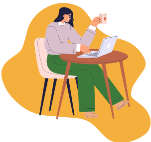
L'assistante Sociale social.passville@rsv84.fr 06 60 45 97 92